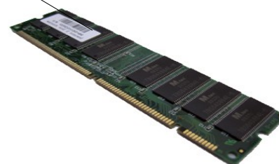
BARETTE Mémoire Vive (RAM)